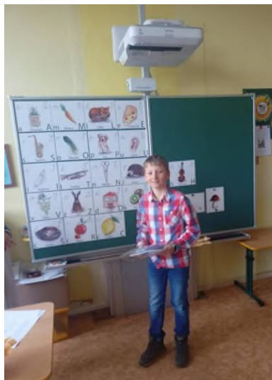
Tým učitelek 1. stupně