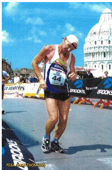
161 životní maratón, cíl u šikmé věže v Pise 2006